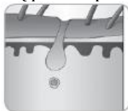
Телоген (фаза на почивка)

Въпреки че продължителността на цялостния цикъл на растеж на косъма е различен при всеки човек и зависи от областта на тялото, върху която расте косъма, той обикновено продължава от 18 до 24 месеца.