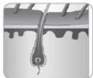
Анаген (фаза на растеж)

Всеки косъм по нашето тяло преминава през три фази на цикъл на растеж: анаген, катаген и телоген. Само космите, които са в анагенна фаза (фаза на растеж), реагират на третиране с IPL.