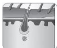
Катаген (преходна фаза)